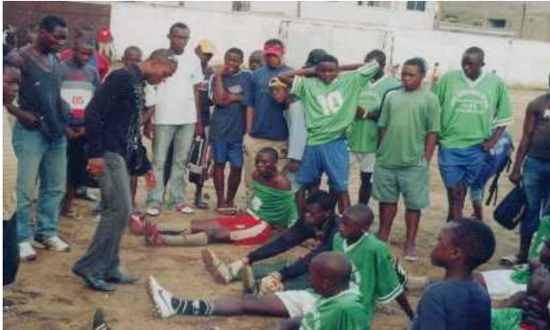
Les joueurs se reposent à la mi-temps et reçoivent des consignes de leurs Coach.