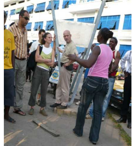
Le Collectif d'animateurs 30 de France et leurs confrères du Cameroun en pleine visite des installations de la DOUAL'ART au