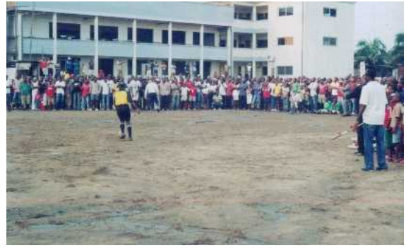
Publique venue au support des équipes en final de Synergie Foot 2007 au CAFRAD de BEPANDA