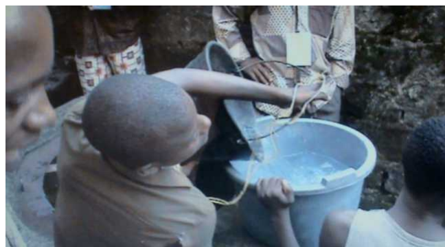
Constat de l'environnement et de la pollution du puits de la mort par les membres du Green and Clean Youth