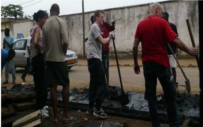
Le Collectif d'animateurs 30 de France et leurs confrères du Cameroun en pleine acte citoyen de propreté dans le quartier Bepanda.