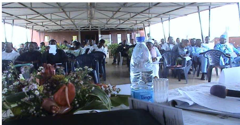
Participants au séminaire de renforcement des capacités organisé à l'immeuble Don Bosco de Yaoundé.