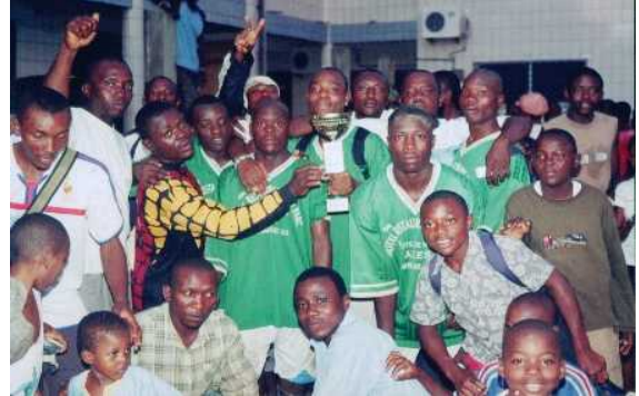
Bouake Football Club remporte la coupe Synergie Foot 2007 sponsorisé par GCY