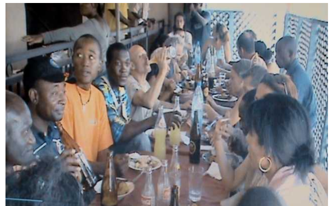
Green And Clean Youth, Le Club Synergie Jeunes de Bepanda et leurs confrères du collectifs d'animateurs 30 de France s'appêtant à déguster ensemble un met d'amitié pour célébrer la fin de leur travaux.