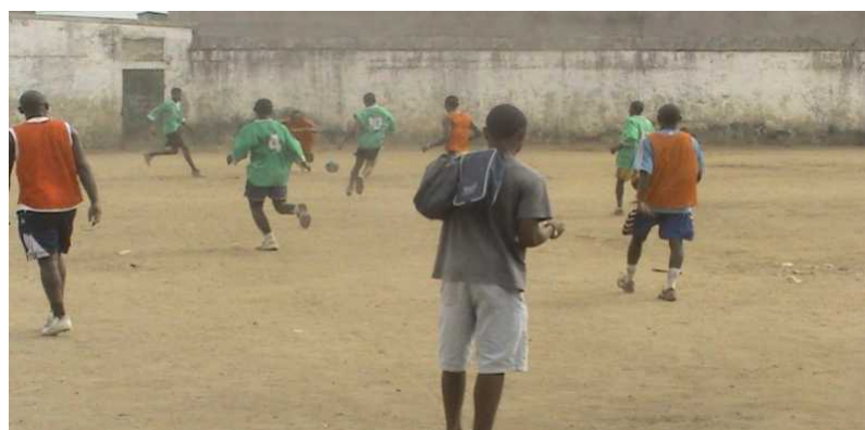
SYNERGIE FOOTBALL CLUB en pleine rencontre amicale contre les jeunes du CASOD pour renforcer leurs liens d'amitié. Cette rencontre avait été sponsorisée par le Green And Clean Youth.