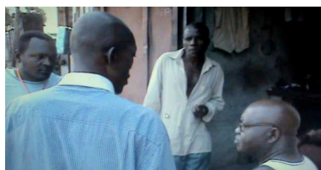
Proposition et recherche des consensus entre les membres du GCY et les usagés du puits de la mort