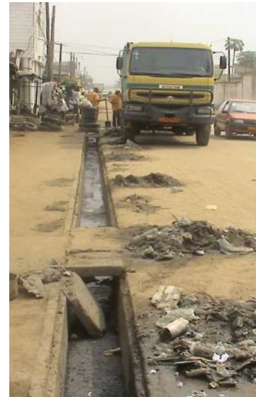
Débouchage des caniveaux a Bepanda avant et après pour permettre une bonne santé des populations environnante.