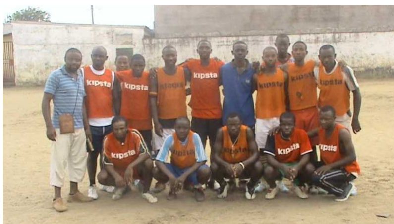
SYNERGIE FOOTBALL CLUB en famille et leur partenaire de Green And Clean Youth