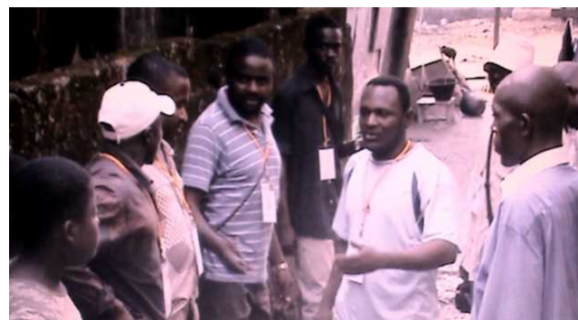
Débat au tour des diverses solutions possibles pour la salubrité des alentours, de la potabilité de l'eau du puits